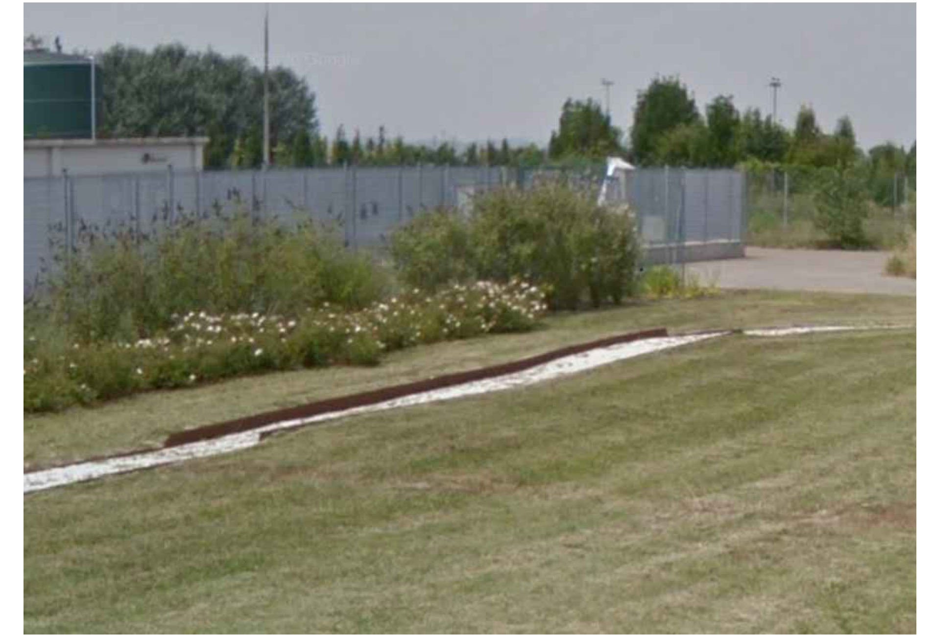
INTERVENTO SIMILARE REALIZZATO SU VIA CERCHIA